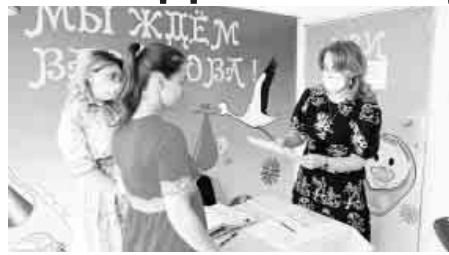
родным или брать с собой во время оформления документов.

Как признаются будущие мамы, такие услуги особенно актуальны и необходимы в непростое эпидемиологическое время. Нет необходимости ходить по учреждениям, переживать за малыша, которого приходилось оставлять