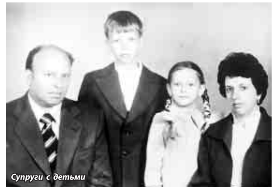
Супруги с детьми

«Яуза-207» и начал записывать песни на семейных торжествах. Потом мы их часто слушали. А какие замечательные были маевки в лесу с бадминтоном и шашлыком! Там были работники завода, дети, бабушки и дедушки. А на Новый год мама всегда печет «Колодец» - брусочки из песочного теста, которые надо уложить в виде колодца и залить сверху белой глазурью в виде сосулеч. Внутри колодца – шампанское, а вокруг – мандарины и конфеты. Уже 28-29 декабря друзья и родственники начинают спрашивать: «Ну что, испекли «Колодец»? Пожелания у «Колодца» действительно исполняются. Думаю, дело не столько в нем, сколько в особом