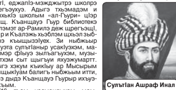
Султан Ашраф Инал