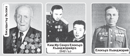
Ким Ир Сенрэ Елокуэ Хьанджэрий. 1946 гъэ

КьЭРАПЫМ, республикым и дэтхэнэ шьыналтэм я ма-дуар, аршывандэхэм я хуа-муэр лэжьыгъэр Хэку зауэ-шхуэм кьэзымудат. Кьуа-рэм зи ады, дэпхьу, кьудэ, Хэку зауэм зымьгъэхуэ унагъуэ кьыдхэнэжэжым. Тылэм и лэжьыкьухэр зэрэхуэз-эдрэпкитэ Текуньыгъэ Иньр кьызэрщытхьэр. Хэку зауэшхуэм дэсэм аршывандэ 500-м яныщхуэ кьызэгъэзэжэр 314-рэц.