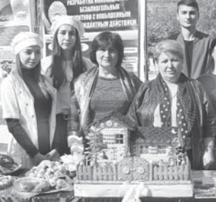
кыруалганды. Кьонаккыны санында КьМР-ни Парламентте жев ачканды. Ол келгенге жорек ырызлыккыны билдиргенди. Ызы бла алгыаркада Москвада этген «Алтын коз арты - 2019» кер-