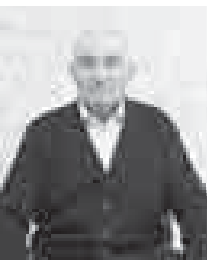
Жерлеринде да атларын иги бла айтыра келгендиге.

Кысы бирбизни да, кыйда өскөк да, гитичендик жоректерибиз теринде тюрлеп кыялган кызыт аппала, ынчакыла эсибизден бир заманда да кетпейди. Ала жаланд олтурган ныгышларын, тирелерин берекети болуп кыялмай, саудай да жерибизни, жамуатыбызны байлык болганын заманында, жарыгына, анылапаймайбыз. Аны энчилиге, теринигине тошоналмайбыз. Жашау кыруу да алай саркырык сунуп, сабылгыбизге хорпата, аны заукулугуна бланьибиз.