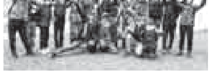
- Хар сабийни да насилы жаушагы эркинлиги барды. Биз а, абаданла, аланы не жаны бла да келлерин алыргыга, эсеринде жаланда ий эсериле кыялына этерге борчулбуз. Лагерьде биз сабийлени кыярылабызны сюере, кеси кочерине ийанырга, салган мураттарына жетерге юйрөтөбиз.

Школчула кытаруучула бла аланы ишлерине да тири кытышы хандыла. Лагерьде туруу алагы гаджетлесиз да дуня бек сейри болгонан ачыкылганды. Сабийлени кесерине борла салп, аланы толтургунчу тынчаймайгы-