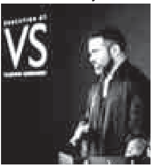
парикмахер искусствода жангы мадарла табып, аланы жашууга кийириуну изилтуйлуден сора бергенди.