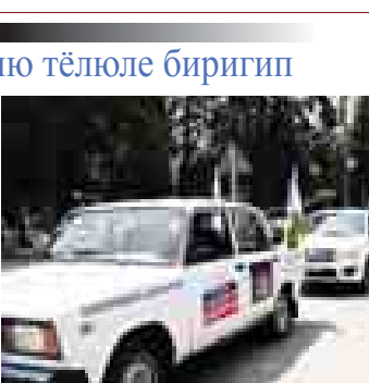
КМР-де МВД-ны пресс-службасы.

Кыабырла кыайда кызылдыла? Тууган жеригизде сынала салып, Аларгынынги анда жаздыла. Ой, кекде баргъан ариу зурнукла, Сиз ызыгызга кыайтырсыз. Мени дуниям кетгенди,