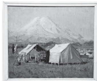
Н. Третьяков «Къош».

Былайда художниклени усталык амаллары, кез кыарамлары да бир бир-