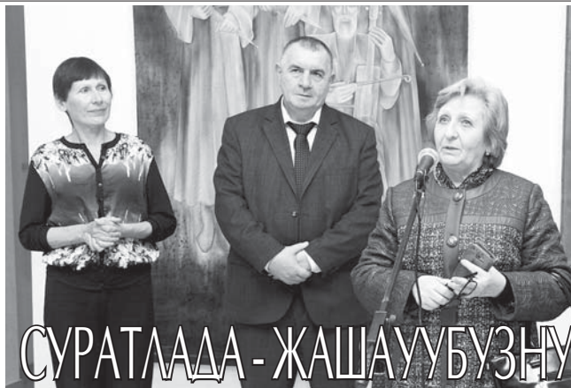
СУРАТЛАДА - ЖАШАУУБУЗНУ