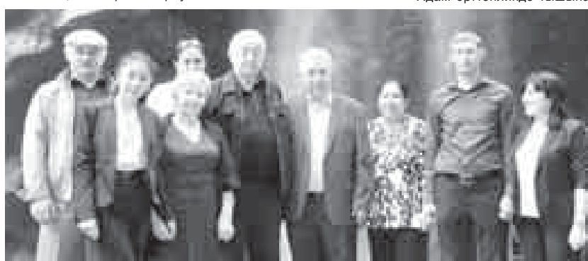
унда къаллай жашуу институтла кырагъанын кѳрпозтенди.

«Къарачайлыланы бла малкыарлыланы бурунгу ийнанылары» («Древние верования