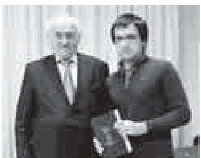
Махти Балаланы Аскер бла. КыМКУ-да одабият тюбешу.

Айхай да, «Ёзден адет» тукъумну да ыспассыз этмейди – огурулу, жигит, чомарт адамлары кеп эселе, аны кыалай ыспассыз этерик эди? Алай ол бек алгъа адамны кесине кыарайды, осалгъа жуу-