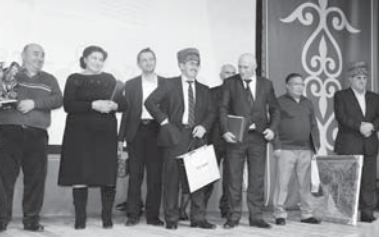
Келген къонакыны къоуму сахнада.

Сахнада поэти къатында Нальчи шахарда Урушуну, урунууну, Саууттанган кочлени эмда право нызамны сакълачу органыны ветерандарыны жамаат организациасыны председатели