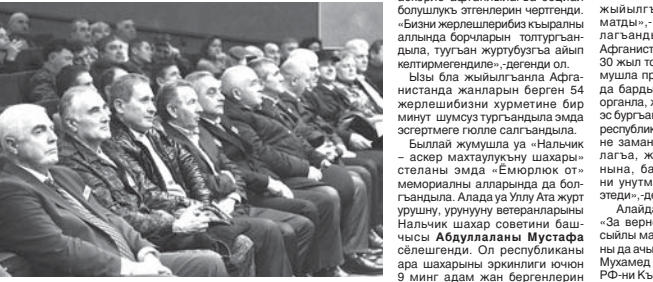
Бир минут шумуз туруу, голле салуу

Совет аскерле интернационал борчларын толтуруу, Афганистанда кьыгарьылганы 30 жыл толганы республикада кьен белгилегенди. Аны чьектеринде Ата журтбузуну кьорьгьучуларын эскертелерине голле салдыргьанды, Кьырал концерт залда уа кууанчлы ингир бардыргьланды.