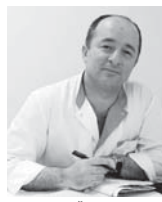
кирген улгай да, карагъан да къыйын эди.

«Заман» газетни багъа-редакциясы биз, черек аууну эллеринде жашаган бир кшаум адам, бу конюнде ара болницабызда саулугъубузга бакъдыра турубуз. Мында болгуну юсюнден да эшитип улгай, кесибиз дурус билебиз. Аны айта келгенбиз не ючюн-дур? Энди бизни, улгайган адамланы, саулугъубуз осал бола багъаны баямды. Ол себепден болницагъа болушукъ излеп терк-терк келгире тошуду.