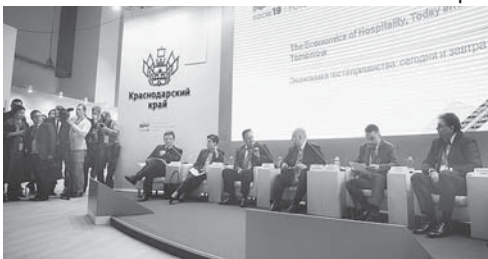
россейли эмда тыш кьыраллы туристлени да кесперине тартадыла. Бизин кьурал эмда кьыраллыкькына саналамган структурала да этген битеу мадарла регионга солурга келгенлини саны бютон кеп болуруна бурулдула. - дегенди ол.