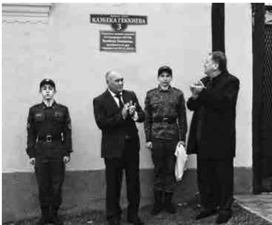
Орамға Геккиланы Казбекни аты берилген жыйылыудан