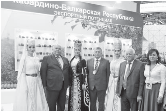
Экспортный потенциал АПК КБР

На заседании «круглого стола» «Стратегия развития мелкотоварного комплекса Российской Федерации. Производство экспортноориентированной продукции АПК»