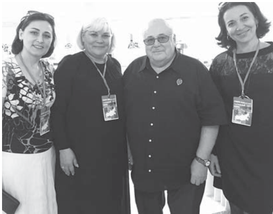
Делегация Русского драматического театра им. Горького с председателем СТД РФ народным артистом России Александром Калгиным

В столице Чечни завершился региональный театральный форум «Российский театр — XXI век. Новый взгляд». Мероприятие собрало в Грозном представителей всех национальных театров Северного Кавказа.