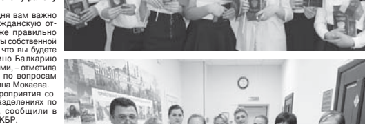
Подготовила Ирина ШКЕЖЕВА

Торжественные мероприятия состоялись во всех подразделениях по вопросам миграции. Посетители получили в пресс-службе МВД по КБР.