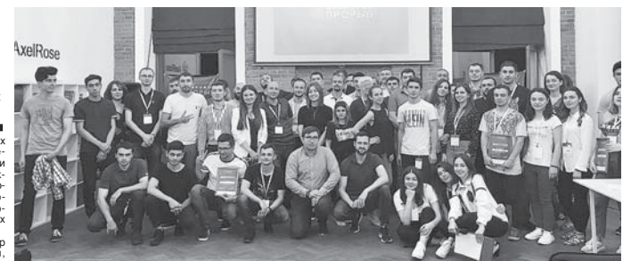
В мастерской управления «Сенеж» – образовательном центре АНО «Россия – страна возможностей».