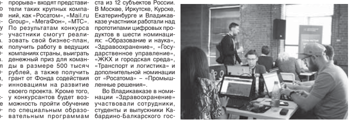
В финале, который пройдёт в Казани с 27 по 29 сентября, примут участие свыше 80 команд – финалистов региональных этапов.