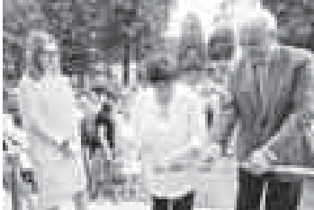
(Окончание на 2-й с.).