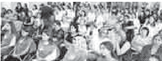
Василия РУСИНА.