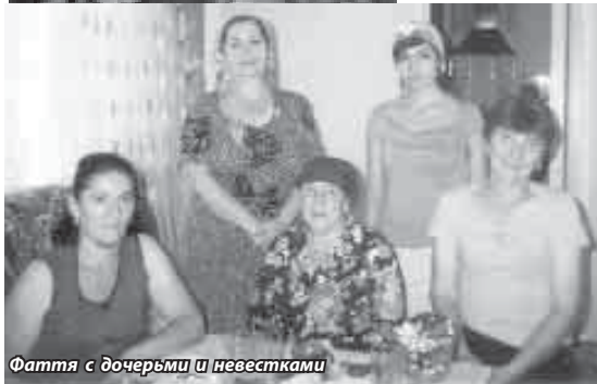
Фаття с дочерьми и невестками

овец, пошла ее выгонять, упала и не могу подняться. Все на работе, позвать некого. Можно было бы прохожих позвать на помощь, но улица пустая. В последние годы она всегда пустая. Конечно, у многих есть машины, но и отъезд людей из сел создает эти пустоты. К счастью, неожиданно на дороге появился прохожий, он и помог мне встать. Нам надо беречь села, если хотим сохранить хоть что-то свое.