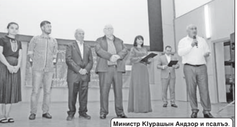
Министр Клурашын Андор и псалъэ.