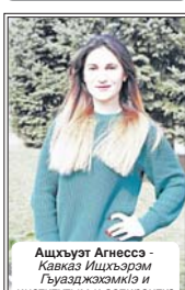
Ашкхъат Агнесса - Кавказ Ищхэрэм Гуызджэжикэ и институтым аспирантэ