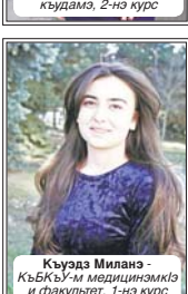
Кьуэза Милана - КъБКЪУ-м медициникэ и факультет, 1-нэ курс