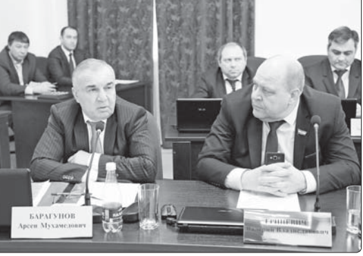
КъБР-м и Парламентым