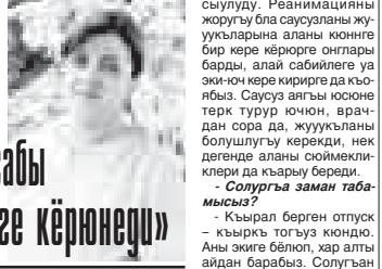
Кызулаланы Аминат республиканы клиника болнысыны реанимация белюмюно таматасы. Анда ишлеген алтмыш юч адамдан жаланды алтыс эч кишиледиле, кыалганлары тиширүүдөлдө.

Сейир этерсиз, алай реанимация шувуулик берлик бек керекдиле. Врачла, медестрала, санитарла бир бирин аргылап, бир тили болуи иштейбиз. Бир игилиги, мында салгыян кыйыныгы хыйсабы терн оккуна керебе. Жанын кэржюу болган саусузу багы кетип, ол кезирини ача - ма ол такый кыйында бизни келюбюз бек блан тең боланды.