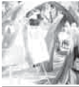
Ахыры 2-чи бетдеди.

гитлени юсюнде» дегенде ол иги кесек мычыгъанды. «Быллый проектке бусагъ-атадагы заманда бютѐн бек керекдиле. Есоп келгенге ѳтгюр жѳрлешлерибизни билселе, аладан юлгю алмай кыорыкъ туюйлдоле. Хар бирибизни гиче ата журтубузну, битеу деменгили Россейни да кючю ма андады», - деп чертгенди ол.