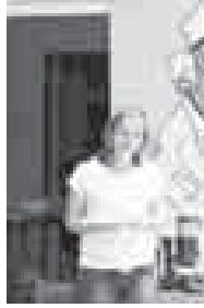
уна ёседи. Атылып турган жерни тап халгъа келтириуге