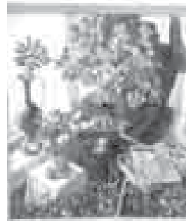
кереклисин да айтханды ол.