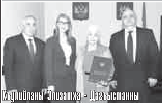
Къулийланы Элизатха - Дагъыстанны