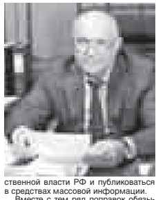
Анатолий Бивов, депутат Государственной Думы РФ и публиковаться в средствах массовой информации. Вместе с тем ряд поправок обяза-

Законопроект представлен в Госдуму Правительства РФ с целью изменения срока подготовки и опубликования национального доклада о ходе и результатах реализации государственной программы развития сельского хозяйства и регулирования рынков сельскохозяйственной продукции, сырья и продовольствия. Предлагается установить срок подготовки и опубликования национального доклада до 15 июля года, следующего за отчетным. Таким образом, срок подготовки документа увеличится на два месяца, что позволит более полно и точно отразить все показатели. Рекомендованным депутатам поправкам предлагается создать независимую экспертную комиссию для оценки результатов реализации государственной программы, а также каждой подпрограммы. Заключение и рекомендации экспертной комиссии будут направляться в органы государственной власти РФ и публиковаться в средствах массовой информации. Вместе с тем ряд поправок обяза-