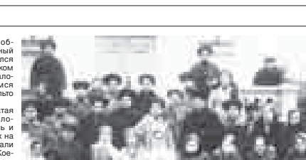
пунктам: от семи до одиннадцати штук на село. В январе 1931 года Кабардино-Балкарский облисполком, подводя итоги кампании «Пальто горняке», отмечал, что полученные объёмы к тому времени дёшево пальто не покрывали реально потребность кабардинских и балкарских женщин в обеспечении тёплой одеждой. И хотя официально кампания подошла к завершению, планы дальнейшего снабжения горняк пальто ставались по другим населённым

платить, то тогда не надо, т.к. мне нечем платить». Интересен сохранившийся в архивах Кабардино-Балкарского областного архива Архивной службы КБР именной список женщин селения Ероково, получивших пальто. Их очень мало всего одиннадцать, так же должно быть и пальто. И вследствие своего фанатизма, что ей стыдно в таком (узком и коротком) пальто ходить, она решила выделиться от палто». В Балкарии, в некоторых наиболее отдалённых районах женщины заявляли, что «пальто мы возьмём, но если мне за него надо