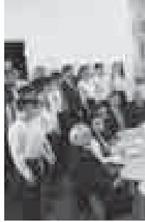
Идея создания дипломатического класса возникла в ходе практической профориентационной деятельности преподавателей вуза.

КБГУ и нальчикская гимназия №4 реализуют новый про-ориентационный сетевой проект «Дипломатический класс» в рамках культурно-образовательного проекта «Кавказская модель ООН «Очаг мира». Его целью является формирование навыков публичной (общественной) дипломатии у подрастающего поколения.