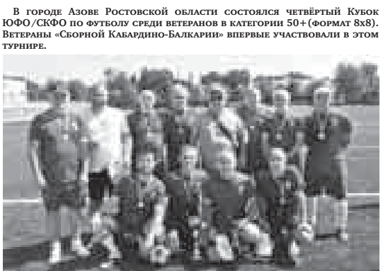
В городе Азове Ростовской области состоялся четвёртый Кубок ЮФО/СКФО по футболу среди ветеранов в категории 50+ (Формат 8х8).