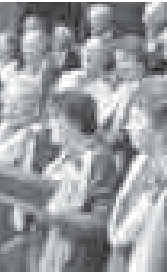
Обязательно исполняем в концертах и репертуар новые аккапельные произведения, которые служат эталоном академического пе-