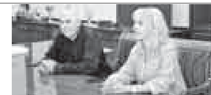
М. ЯРОСЛАВСКАЯ.

Валерия поблагодарила руководство республики за высокую оценку её де- ятельности и вместе с мужем выразила готовность вновь посетить Кабардино- Балкарию.