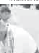
Василиса РУСИНА.

«пэпворк», свистильники, выполненные в технике злинико-го витража, создавали атмосферу домашнего уюта и тепла, дополняя праздничным колоритом, мерно качалась национальная палатка, доносившая запахи блюд еврейской кухни, развлекали на лёгком ветру узорные белорусские рубашки. Национальные культурные центры республики представили праздничные экспозиции, в очередной раз демонстрируя крепость межрегиональной дружбы в Кабардино-Балкарии.