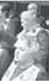
ни. Хор гордо носит звание «народный» («образцовый»), которое присваивается коллективам художественной самодеятельности, которые являются лауреатами или дипломантами смотров, фестивалей и конкурсов различного уровня».

авторов, так и загорные народные произведения, которые поднимали настроения прижизни и потом, сорвавшись за столиками уличного кафе.