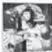
тересные творческие работы, дающие надежду на дальнейшее сотрудничество с ними в этой области, выражающиеся