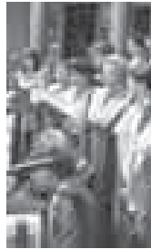
Соловьева-Седого, автора таких известных и всенародных любимых песен, как «Пора в путь-дорогу», «Мы друзья, перелетные птицы», «Улысь меня, хораша», и десятков других.

Многие нальчане знают о давней городской традиции: в дни всенародных праздников на площадке у кинотеатра «Восток» в подвале выступает хор ветеранов войны и труда «Эстабета». В этот раз к самому крупному ветеранскому творческому коллективу Республики присоединились хор казачьей и украинской песни «Родник».