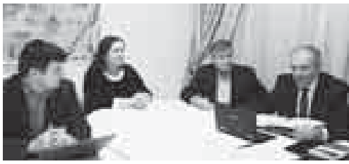
О БОЛЬШИХ ПЛАНАХ НА 2018 ГОД ШЛА РЕЧЬ НА РАСШИРЕННОМ ЗАСЕДАНИИ СОВЕТА КАБАРДИНО-БАЛКАРСКОГО РЕГИОНАЛЬНОГО ОТДЕЛЕНИЯ ВЕРОСИЯСКОЙ ОБЩЕСТВЕННОЙ ОРГАНИЗАЦИИ «РУССКОЕ ГЕОГРАФИЧЕСКОЕ ОБЩЕСТВО».