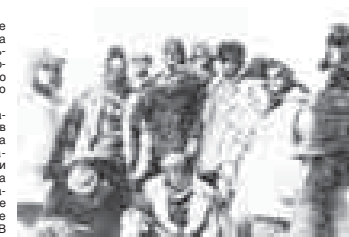
Февраль 1943 года. Советские альпинисты на вершине Эльбруса

КАЛЕНДАРЬ 1 февраля 1963 г. – создание на базе Прохладненского района КБАССР Прохладненского сельского района с центром в г. Прохладном с включением в него частей Баксанского и Майского районов КБАССР. 2 февраля 1943 г. – окончание Сталинградской битвы, в ходе которой советские войска отстояли и освободили Сталинград, взяли в плен остатки армии генерал-фельдмаршала Ф. Паулюса. Победа под Сталинградом имела огромное политическое, стратегическое и международное значение. В этой битве участвовали уроженцы Кабардино-Балкарии. 7 февраля 1918 г. – родился Н. К. Шогенов – видный деятель народного хозяйства КБР. 15 февраля 1993 г. – регистрация исполнительного комитета Конгресса кабардинского народа (ККН). 16 февраля – 5 марта 1918 г. – в г. Питгозеро состоялся второй съезд народов Терской области, провозгласивший Советскую власть в Терской области. 17 февраля 1943 г. – советские альпинисты сбросили с вершины Эльбруса фашистские вымпелы и торжественно водрузили государственные флаги СССР. 19 февраля 1993 г. – первый