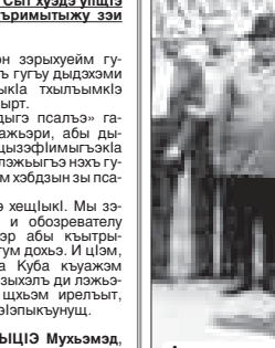
Адыгэ журналист Шхьалыкьуэ шьхь зилэ, 1978 гьэ