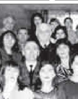
«Адыгэ псалъэ» зыгьэзэр гупы, 2004 гьэ