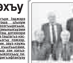
Журналист нэжькьышхь А гьусуэ, 1995 гьэ