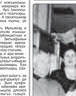
«Адыгэ псалъэ» зыгьэзэр гупы, 2004 гьэ