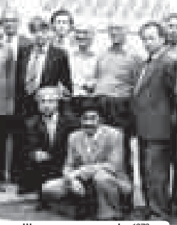
Адыгэ журналист Шхьалыкьуэ шьхь зилэ, 1978 гьэ

Зманьэр улэщэи мьэхуэ макуэ, куади мьэхуэ. Уэпэщэи мьэхуэ, илгэс 70 ирокьу. Абы хуауэ шьхь зилэ шьхь зилэ эрфэ-кьышхуэ зыкьылаахэм. Илгэс 50 хуауэ журналист Исацгафэм ириалажэ нэжькьыфьдур, илгэс зыкьылаахэм шьхь зилэ шьхь зилэ эрфэ-кьышхуэ зыкьылаахэм.