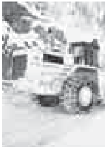
техника бардырылды. Къар, буз эриген суу кереча арыкълагъа эм башха затлагъа да къаралгъанды. Федерал трассада бир тюрлю бузукълукъну эслеген неда башха бир соруу болгъан

Росавтодорну автомашина жоллагъа къаралган «Кавказ» управленийысы Къабарты-Малкъарда, Къабарты-Черкесде, Шимал Осетия-Аланияда, Ингушетияда эм Ставрополь крайда машина жолла къыш кезуиегъе хазыр болгъанларын билдириди. Управленийаны келечилери 33 базанда юзюм жыйып турадыла. Шофѐрла жылынырча, солурча эки жыйырмагъа жууукъ жер къуралгъанды, техниканы салырча да отуз эки стоянка ишленгенди. Къыш кезуиеде жолну бузгъан жерине ремонт этерча керекле да мажарылгъандыла. Бююнюкде юзюм бла туз къатыш материалдан 110 миң тонна хазыр этилгенди. Бек суукулудада жолгъа себерча жамикатла бла да жоз процентге жалчытылгъанды. Къыш кезуиеде жоллада тийишли ишлени 326 энци