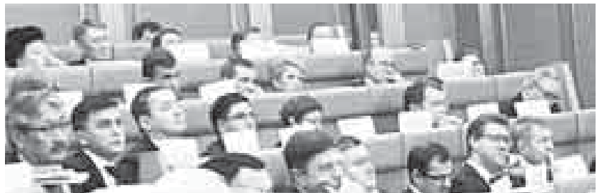
КъМР-ни Башчысыны бла Правительствосуну пресс-службасы.

31 октябрьде РФ-ни Правительствосуну башчылары бла тубешиуонде Россейни Президенти Владимир Путин регионланы бир къауумуна, ол санда Къабарты-Малкъарга да, федерал бюджетден энчи халда кредит берирге оную этген эди. Ол ахча рынок борчуну бир кесегин төлерге эмда коммерция ёнкюкню кеси фаидаларыны жартысындан озмагъан ёлчемге жетдирирге деп бериледи.