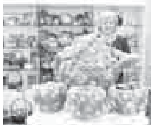
билдиргендиле муниципалитетни администрациясында.

завод. Алай бла аны акъ будай ундан этилген «Юбилейный» эмда къара будай ун кшошуп биширилген «Боярский» ётмеклери ючюн алтын майдал берилгенди. Ол а предприятие продукциясыны качествусу бийик излемлеге келишенин шарт кёрюзтеди, деп