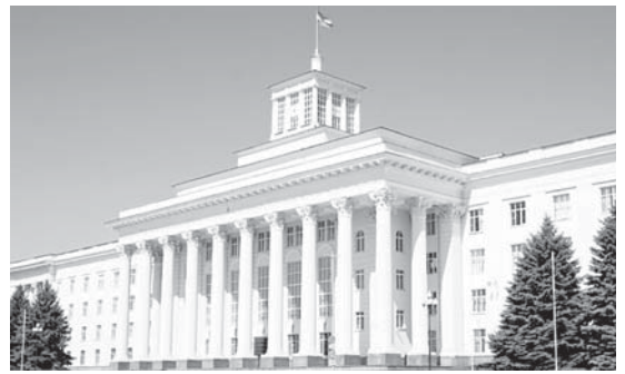
КъМР-ни Башчысыны бла Правительствосуну пресс-службасы.

Кенгешге къатышханла транспорт объектле, маданият, социал инфраструктурала къуанчлы ишлеге къалай хазырлангъанларыны юсюнден билдириуге тынгылагъандыла. Бу ишге жамауат организациялары, ветеран эмда жаш тёлю биригулени не къадар тири къатышдырууну дурус кёргендиле. Къоркъуусулукъну жалчытыугъа, кюч структурала бла право низамны сакълаучу органла ишлерин бирге келишип бардырыгъа кереклисине энчи эс бургъандыла.