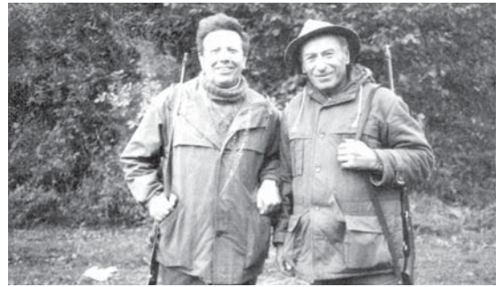
Академик Евгений Чазов бла.

Жыл сайын бардырылган альпинидада бери жерни кыай-