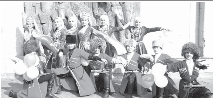
«Эльбрус» ансамблини келечилери.

Былыр сагьынылган арада 24 сабий биригиу ишлегенди. Алагьа башха-башха жыл санда 1 166 жаш адам жюрюгенди. Аланы араларында кеп балалы, кьолайсыз юйорледен да бардыла. Андан сора да, саулыкълары бла байламлы чекленген онглары