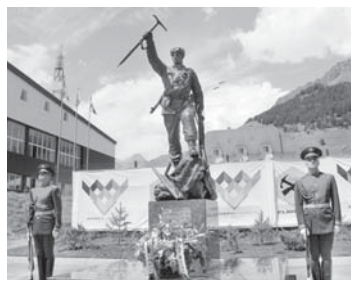
Ахыры 2-чи бетдеди.

«Эльбруское кольцо-2017» аскер эришуле бошалгандыла. Алагы Ираны, Къазахстанны, Узбекистанны, Кытайны, Мароккюну, Россия Федерацияны да жыйымдык аскер кючлерини келечилери къатышхан эдиле. Ала 3,5 километр бийликке кюзбекилометрлик жолну къыдыргандыла, сегиз тау аудухан аугандыла, жети чырандан, ю да черекден этгенди, Европаны бек бийик тауу – Эльбруска – кетюрюлгенди.