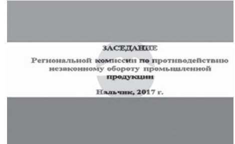
Ол экономика, финансла, аш-азыкъ къоркъу-усулукъ эмда адамланы жашау къолайлыкларын игилендириу бла байламлы вопрослагъа къарайды.

ны бла дарманланы 59 тюрлюсю сыйырылганды. Жыйылыуда толтуруучу власть органланы иш-лерин бирге тийишдириу, болумгъа дайым да кёз-кыулак болуу, тинтиулени къыйматларын ёсдюрюу келир заманны баш борчларына саналгандыла. Промышленность продукцияны законсуз сатыу-алыуға къажар регион комиссия Россей Федерацияны Президентини 2015 жылда 23 январьда 31-чи номерли Указы бла къуарлганын эсигизге сала-