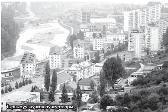
Тырнауузу жашау журтлары.