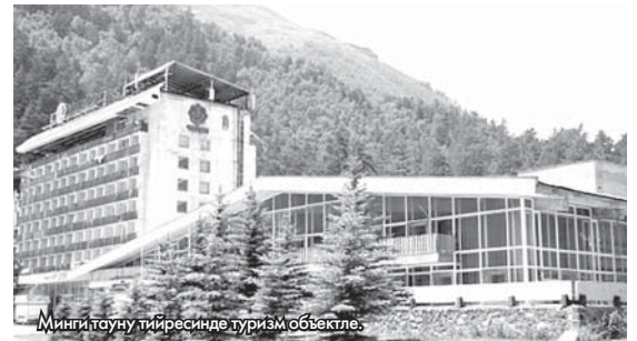
Минги тауну тийресинде туризм объекте.

Кеси заманында Маданият юй, Сабий чыгъармачылыкны школу, орта билим берген бир неча учреждение, сабий садикле, профтехучилище, «Эсен» профилакторий, «Искра» кинотеатр, «Геолог» эм «Бахсан» спорт комплексле ишленген эдиле. Кьонакъ