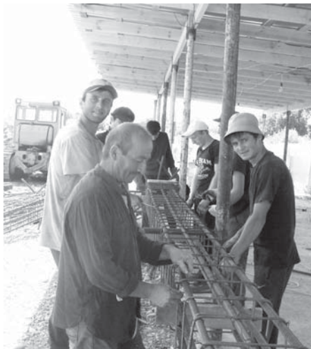
«Потенциалны» бригадасы каркасла жыйган кезиуде.