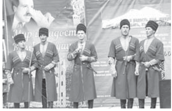
«Инар» жырчы кьауум.