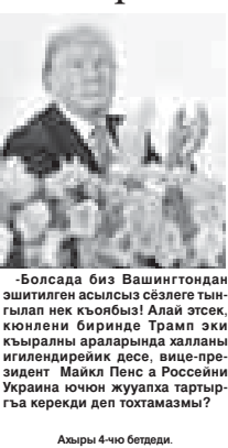
Ахыры 4-но бетиди.

«Болмаса биз Вашингтонда эшилген асылсыз сёлеме тын-гылап нек сюйюбиз! Алай этсек, кюялени кербониде Трамп эски къыралны араларында халланы игилдериюм десе, вице-президент Майкл Пенс а Россияни Украина ючюн жууахха тартыргъа керекди деп тохтамазгъа»