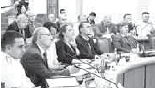
Ахыры 2-чи бетдеди.