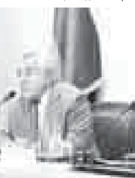
Ахыры 2-чи бетдеди.

Сагъынылгъан кезиуге хазырлануу ишини чеклеринде жѳр-жѳрли администрациала 114 миллион сом багъасына мадар этерикдиле. Дауғыда министрстволары бары да кѳп къалай 80 миллион сом къоратыркъдыла. Электротюкю бла жалчытуучу «МРСК СК» компанияны республикада бѳлюмю - 96,4 эмда «Газпром