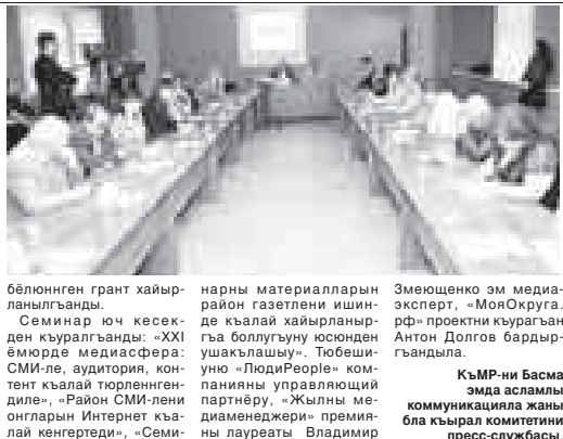
Къ-МР-ни Басма эмда асамлы коммуникативия жаны бла кырал комитетини пресс-службасы.

Семинар Интернет - басма органланы огларын кенгертичю себеби 2017 жылы 16 июнда Нальчикде «Район СМИ-лени онгарын Интернет кылай кенгертеди – аудитория, контент, реклама бла ишлеу» деген ат бла семинар бардырылганды. Аны ОГУП «Росейни Информациа телеграф агентствосу» (ИТАР-ТАСС), ТРОО «Гражданский союз» праволу технологияны арасы, ГКУ «КБР-Медиа» кыругандыла. Окуу «Центр общественных коммуникаций» Мок Округа: развите прикладных компетенций журналистов и редакторов районных и сельских СМИ через организацию открыток экспертных площадок в регионах РФ» проектин чегинде кыралганды. Проектни жашауда бардырырга кыралыны жаныдан болушук этленди. Гитче шахарада бла элдеде граждан тирлиге себеп болуу «Перспектива» фонд бардырган конурсха керё. Росей Федерацияны Президентини 2016 жылы 5 апрелинде «КБР-Медиа» кыруган керё.