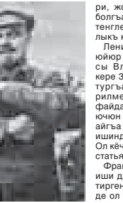
Владимир Ленин (ол тутуаны 22 апрельде 147 жыл толганды) пролетар революцияны бачамасы.

- Ленин эмиграцияга кетгенди, анасыны уа, жыл саны келип, кыарыу жетмегенди. 1899 жылда мюлкю помешик Данилинге 3500 сомга саткандыла (алдынган а ол 800 сомга этиген эди). Арта уа Ульяновла заманында