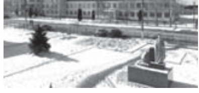
болдурганла тийишлиде. Ол мектепни таматасы, устазлары да биригип, кыйымталы ишлегенлерин шарт ачыкклайды. Бизни корр.

байламлы вопрослагга жоралды школ билим беруу учрежденилганы арасында бардырылган битеуроссей кермочно лауреаты болганды. Проекте школла, лицейле, гимназияла, колледжге, вузла, билим беруу арала, тийишли управленяла, департаментте эм башхала кыатышканды.