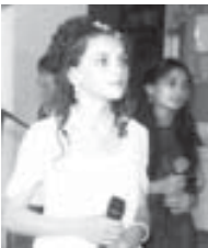
бардырылган «Звонкие голоса» деген вокал конкурса хазырлаганды. Сагынылган жыр эршишу, эрттеден бери да тейлерге айланп, жыл сайын кыруалады. Ол кеси да