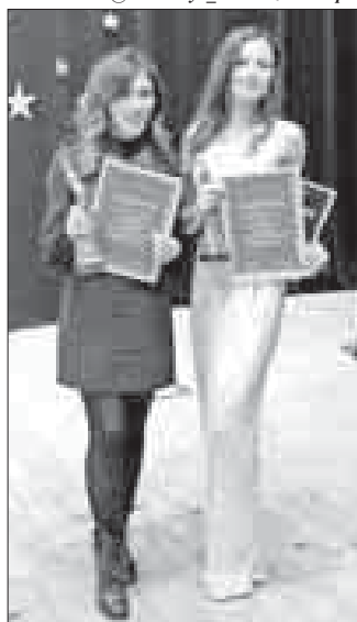
Фото и видео на YouTube и в Instagram @sovetskaya_molodezh_asmora.