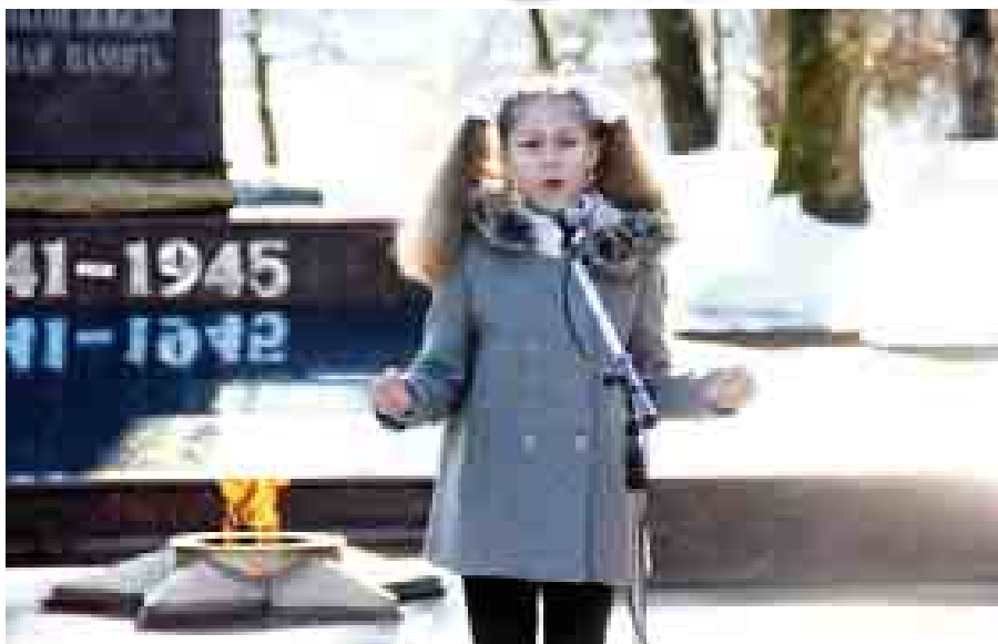
9 декабря в столице Кабардино-Балкарии прошли мероприятия, приуроченные к Дню Героев Отечества

В честь Дня Героев в 10 утра у мемориала «Вечный огонь Славы» состоялся торжественный митинг, на котором присутствовали ветераны Вооруженных сил и правоохранительных органов, представители органов местного самоуправления, общественных организаций, студенты вузов и учащиеся школ республики.