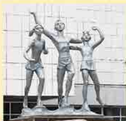
Скульптурная композиция «Бегущие дети»