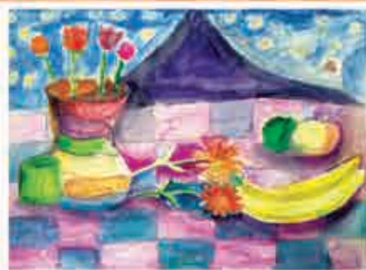
Дария ХАЖИКАРОВА, 7 «Б» кл., с. Старый Черек