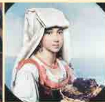
Неаполитанская девочка с плодами