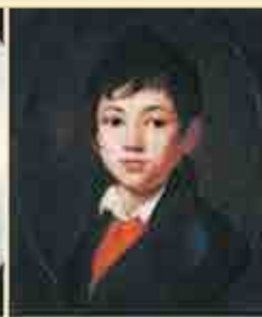
Портрет А. А. Челищева