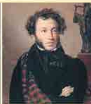
Портрет А. С. Пушкина