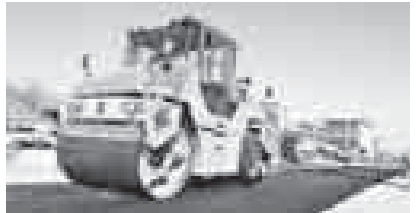
Завершён капитальный ремонт улиц Комарова и Эльбрусской, там произведена замена всей дорожной одежды, бордюрных камней, тротуаров, установлено уличное освещение. — На сегодняшний день готовы улицы Комарова, Эльбрусской и Калюжного ниже Эльбрусской. Столь масштабные работы со времени обустройства этой улицы не проводились. Все поставленные задачи мы выполнили досрочно, — уверяет М. Бегидов. Юрий ТАЛОВ