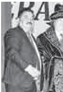
авторским исполнением поэтических произведений. Прозвучала и фонограмма стихотворения Евгения Евтушенко

Многие поэтические строки Кулиева стали крылатыми. Название литературно-музыкальной композиции, исполненной в этот вечер, — тоже строка из стихотворения Кайсына Шуваявича «Мир и радость вам, живущие!». Программу составили видео- и аудиозаписи, благодаря которым участники вечера увидели поэта на киноэкране, услышали его голос, рассуждения о друзьях, наслаждении