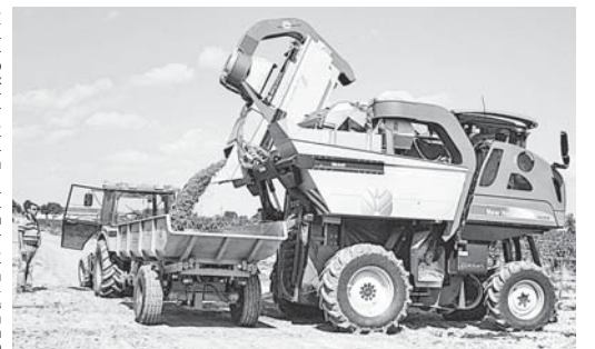
Уборка винограда в агрофирме «Алькасар» Урванского района

Стоит также напомнить, что новая форма кредитования представителей аграрного сектора экономики касается заёмных средств по льготной ставке, выданных сельскохозяйственным товаропроизводителям, осуществляющим производство, первичную или последующую переработку сельхозпродукции и дальнейшую реализацию.