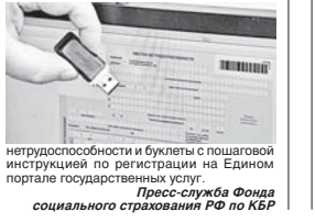
нетрудоспособности и буклеты с пошаговой инструкцией по регистрации на Едином портале государственных услуг. Пресс-служба Фонда социального страхования РФ по КБР

Фонд социального страхования проводит цикл семинаров по разъяснению порядка оформления электронных больничных. В очередном обучающем семинаре в региональном отделении фонда по Кабардино-Балкарии по переходу на электронный больничный приняли участие более 150 представителей медицинских организаций. Специалисты регионального отделения познакомили слушателей с техническими особенностями перехода на электронные листки нетрудоспособности и ответили на многочисленные вопросы. Кроме того, участникам наглядно продемонстрировали порядок регистрации на Едином портале государственных услуг. По окончании встречи все участники получили памятки об электронном листке