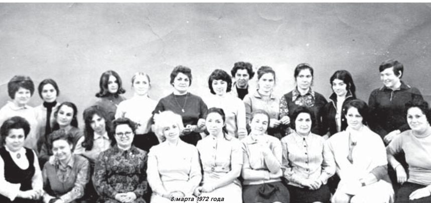
8 марта 1972 года