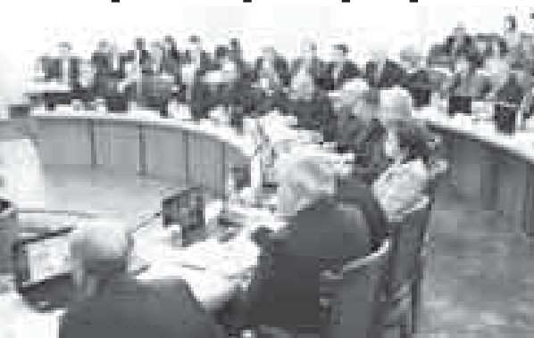
«жол картадан» бир жанына таймай, ишни тохтаусуз, тынгылы бардырып тургуба кереликсин чертгенди.

Аны бла бирге адамланы тозураган юйлерден кечерюуге, кеп сабийли юйлерге библик этюуге, ол санда аланы жер участкала бла жалчытууга, садиклени санын кечерюуге, алауа очередалени кетерюуге, библиекталаны китапла бла толтурууга да эс бурладыла. Тюрю-тюрю къауулагыла кетиргенде болушк сылтаулана азайтуу, милете аралы келешимюню кочлендируу, экстремизмни жолун кесюу, жангы ишни жерле кзуруу, инвестицияны кечерюу, сакъталаны ондуруу эмда кеп баша борчла да салынадыла. Алары эсгергенден сора, Юрий Коков белгиленген