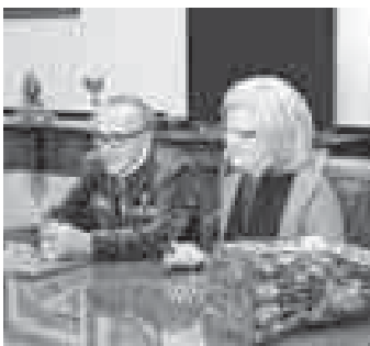
КъМР-ни Башчысыны бла Правительствоу пресслужбасы.

«Сизни чыгармачылыгыгызгуба, - дегенди Къабарты-Малкъарны Башчысы, - жамауат уллу эс бурды. Ишлеригиз республиканы музейлеринде кеп санда болургуба керекди, ол магнаналды.