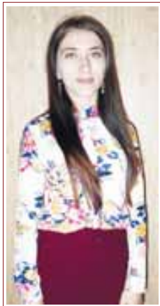
-Фериде, бир кыауум конден санга жашаууну жангы бети ачылыгы. Устаз болуп бирини дөрсинге барлыксы. Кыаллай сезим билейди шеваю сени?

«Кыайсы жерде да болсун, иште энди жангыдан келип адам бир кесек абызыраган да эте болу. Менде да барды ол сезим, алай сабиле бла манга кыиын болуучу сунмайла. Нег дегенде аланы бек союме, дөрге барырга да артык кыоркымайла. Кесиби школда окууган заманын эсте тоюсоп, устала бизде предметтерни школор берсе, биз да аны жюргөзбөй бла жаратканбыз, сейриби кыозгылап, окуугура, билгирге да талпынганбыз.